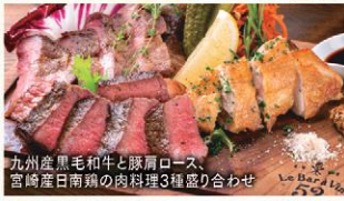
九州産黒毛和牛と豚肩ロース、宮崎産日南鶏の肉料理3種盛り合わせ