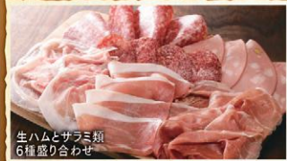
生ハムとサラミ類6種盛り合わせ