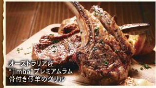
オーストラリア産「jimba」プレミアムラム骨付き仔羊のグリル