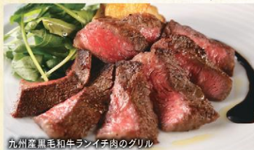
九州産黒毛和牛ランイチ肉のグリル

◆ 本日のパスタ 《ウニと24ヶ月熟成バルミジャーノ・レジャーノの濃厚ウニクリームパスタ》に内容を変更できます。 お一人様につき+¥550(税込)