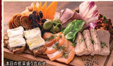
本日の前菜盛り合わせ

◆ 本日のパスタ 《ウニと24ヶ月熟成バルミジャーノ・レジャーノの濃厚ウニクリームパスタ》に内容を変更できます。 お一人様につき+¥550(税込)