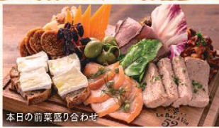
本日の前菜盛り合わせ